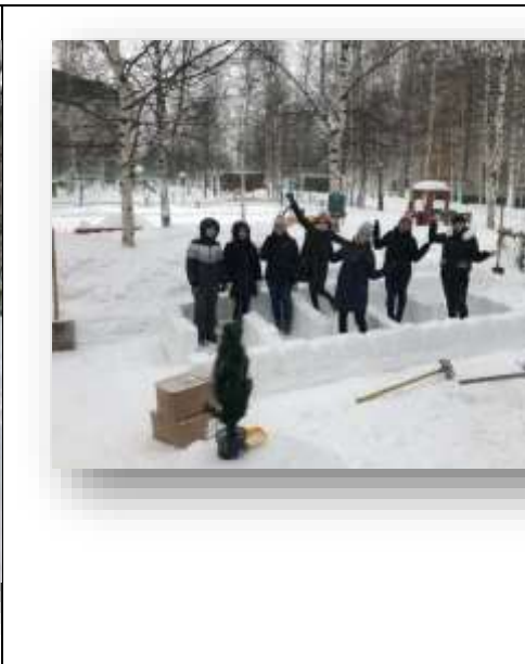
«Парад малышей на 23 февраля»