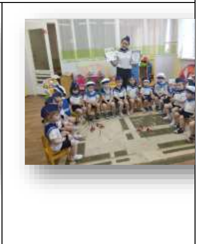
Он-лайн-конкурс в ДОУ зарядок «Юные спортсмены»